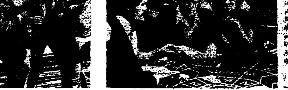
جيسيس كان يلعب «الروديو»

جيسيس كان يلعب «الروديو»... (جزء من مقالة)